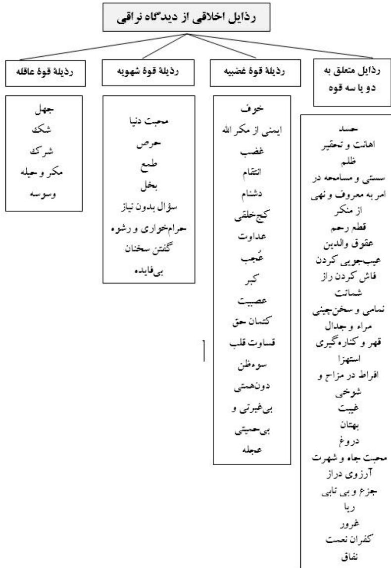
جدول ۱. ردایب اخلاقی از دیدگاه نراقی (نراقی، ۱۳۸۸)