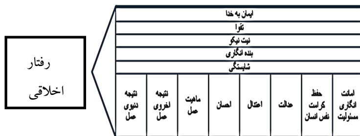
شکل ۲. الگوی پیشنهادی برای ارزیابی رفتار اخلاقی در سازمان‌های ایرانی

بر اساس نتایج پژوهش، مدل شکل ۲ به عنوان الگوی ارزیابی رفتاری اخلاقی در سازمان‌های ایرانی پیشنهاد می‌شود. در این الگو، معیارها به صورت یکپارچه در نظر گرفته شده‌اند و مضامین حسن فاعلی در عرض مضامین حسن فعلی قرار می‌گیرند. این بدان معناست که هر یک از معیارهای حسن فاعلی باید همواره و در هر مرحله از ارزیابی حسن فعلی، مدنظر باشد. درباره ارزیابی رفتار از بعد حسن فعلی می‌توان به صورت مرحله‌ای و گام‌به‌گام پیش رفت؛ در ادامه هر یک از معیارها تشریح شده است: