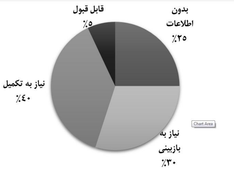
نمودار ۳: وضعیت کلی مقیاس‌های اخلاق در ایران بر حسب مطلوبیت

از سوی دیگر هرچند درصد فراوانی‌های حوزه‌های سه‌گانه اخلاق در پژوهش حاضر فاصله زیادی از یکدیگر ندارند (۴۰ درصد حوزه درون فردی؛ ۲۸ درصد میان فردی؛ و ۳۲ درصد اجتماعی-سازمانی)؛ اما ظاهراً حوزه اخلاق درون فردی بیشتر مورد توجه پژوهشگران ایرانی بوده و این برخلاف تحلیل کلبرگ (۱۹۸۷)؛ به نقل از لپسلی، (۲۰۱۸) از سازه‌های اخلاقی است که تقریباً تمام سازه‌های اخلاقی را امر غیرفردی تلقی کرده است. همچنین طبق یافته‌ها (ر.ک جدول ۵) در طبقه‌بندی مقیاس‌های حوزه‌های سه‌گانه اخلاق بر حسب وضعیت کلی پارامترها، ۵۴ مورد (حدود ۶۰ درصد) از مقیاس‌های حوزه اخلاق در ایران مبتنی بر منابع، متون، یا اندیشه اسلامی بوده، و ۳۸ مورد دیگر (حدود ۴۰ درصد) بر اساس تحلیل‌های میدانی یا دیگر اندیشه‌ها تدوین شده است. این موضوع نشان‌دهنده آن است که از منظر پژوهشگران ایرانی، سازه اخلاق با سازه دین در ارتباط است؛ موضوعی که یک‌بار دیگر بحث پرچالش رابطه اخلاق و دین (اوجاقی، ۱۳۸۶)، و به تبع آن،